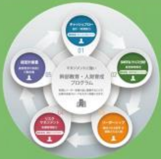
ペンタゴン・メソッド