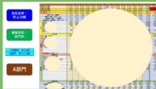
部門別収支報告書